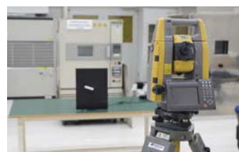
回転体追尾耐久テスト