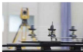
高速振動追尾テスト